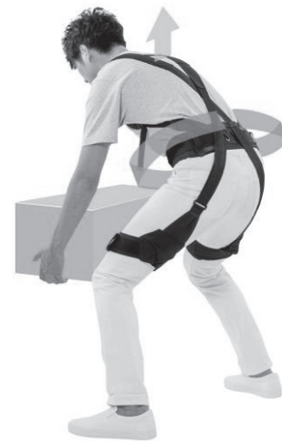
【図表1】スマートスーツ ® の着用例と仕組み

(2) 株式会社スマートサポート 今回紹介する中腰姿勢筋力ア シストスーツ「スマートスーツ ® 」 (図表1)を開発したスマートサ ポート社( https://smartsupport.co.jp/ )は、北海道札幌市に拠 点を構える会社です。農業コン